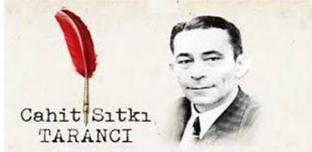
Cahit Sıtkı TARANCI